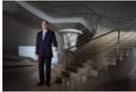
RAFAEL MORENO VALLE / 2016 Gobernador de Puebla