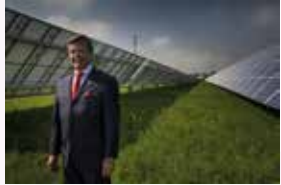
CARLOS PERALTA / 2015 Presidente del Grupo IUSA