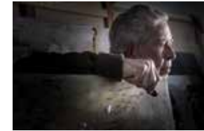
MANUEL FELGUERIZ / 2018 Pintor y Escultor