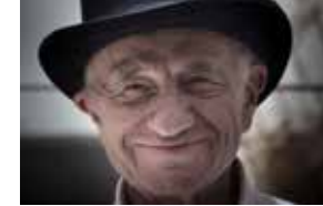
PEDRO FRIEDEBERG / 2015 Artista Plástico