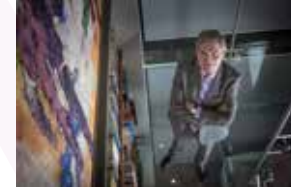
LIEBANO SAENZ / 2015 Presidente de Gabinete de Comunicación Estratégica