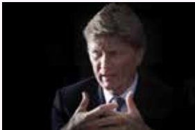
ENRIQUE DE LA MADRID / 2016 Secretario de Turismo