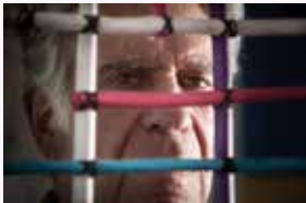
EDUARDO TERRAZAS / 2016 Artista Visual